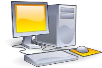
Obrázek 2: Osobní počítač

Tato věta byla napsána a několikrát zopakována, aby bylo možno demonstrovat umístění obrázku obtékaného textem. Tato věta byla napsána a několikrát zopakována, aby bylo možno demonstrovat umístění obrázku obtékaného textem.